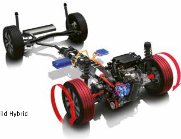
■ Mild Hybrid

Nový 48 V systém SHVS Mild Hybrid pozostáva zo 48 V ISG (integrovaného štartovacieho generátora) s funkciou elektromotora, 48 V lítiovo-iónovej batérie a 48–12 V meniča DC/DC. Vďaka zvýšenému prívodu napájacieho napätia v porovnaní s bežnými 12 V systémami sa zvyšuje množstvo energie rekuperovanej pri brzdení a zároveň miera asistencie elektromotora v záujme znižovania spotreby paliva a optimalizácie jazdného výkonu.